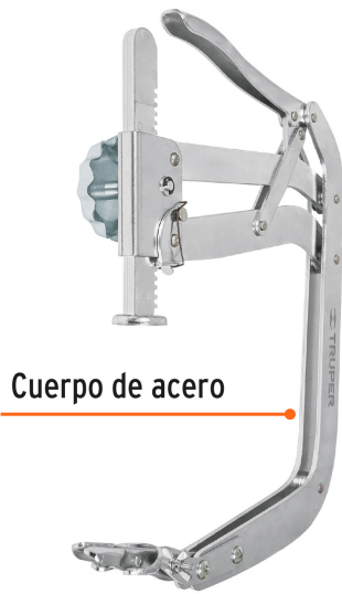
Cuerpo de acero