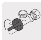
1/4 Vuelta Suave apertura