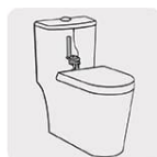
Para W.C. de 1 pieza