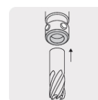
Zanco tipo Weldon