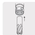
Zanco tipo Weldon