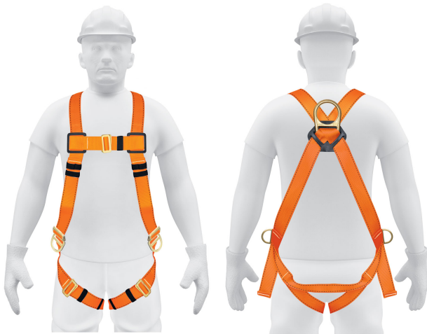
Anillo "D" de acero forjado