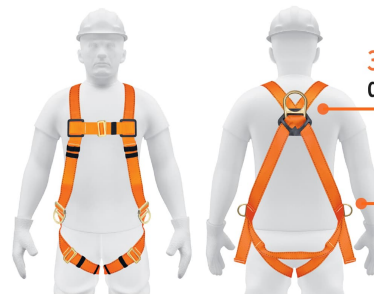
3 Anillos "D" de acero forjado