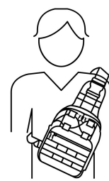
Bolsa de pecho