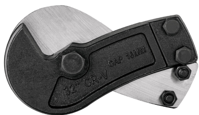
Cuchillas de acero al cromo vanadio en forma de gancho