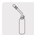
Conector 1" 20 UNEF