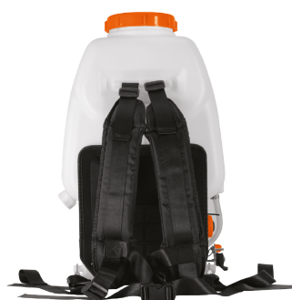
Incluye soporte de espalda y correas acojinadas que reducen la vibración y brindan comodidad