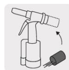
Recolector de vástagos