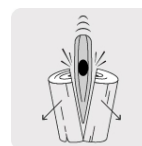
Para rajar madera