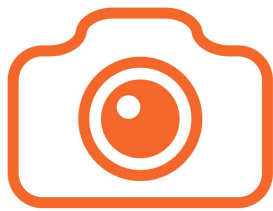
Imagen no disponible