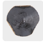
Zanco P3 antiderrapante