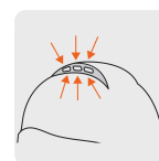
Ranuras de ventilación en la parte superior del casco