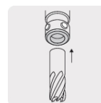
Zanco tipo Weldon