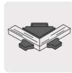
Para uniones de esquinas