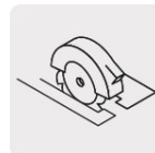
Para sierra circular alámbrica e inalámbrica