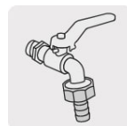
Para llaves de esfera de jardín