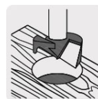
Orificios con fondo plano