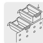
Pestaña posterior para rieles o rejillas