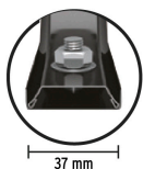
Soporte Calibre 16 (1.5 mm espesor)