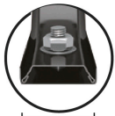
Soporte Calibre 16 (1.5 mm espesor)