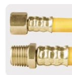
Conectores de latón