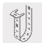
Cinta impresa por ambos lados