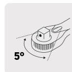
Mecanismo de 72 dientes