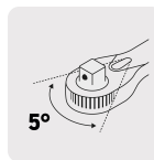
Mecanismo de 72 dientes