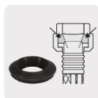
Empaque antifuga con diseño cónico