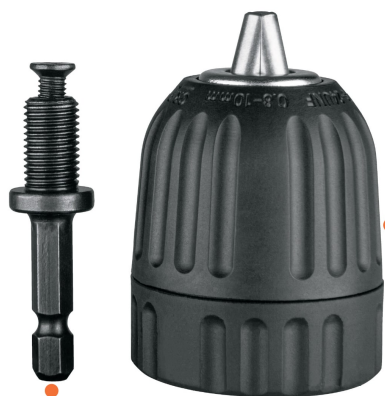
Cuerpo de nylon