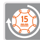
Movimiento orbital, no genera remolinos