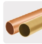
Metales no ferrosos (cobre y latón)