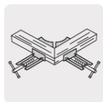
Para unión de marcos