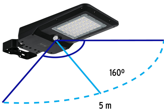
Ángulo y distancia de detección