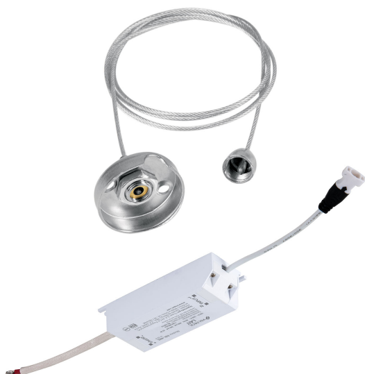
Incluye driver y tirantes para instalación