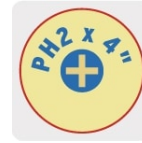
Marcado y código de color