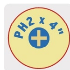
Marcado y código de color