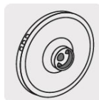
Impulsor de acero inoxidable