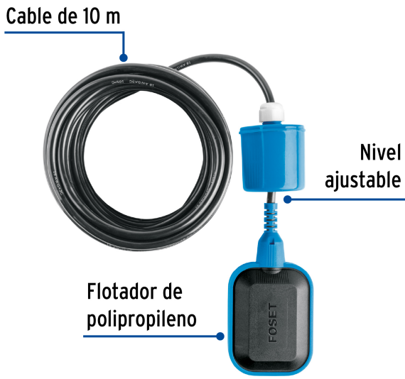
Diagrama de flotador