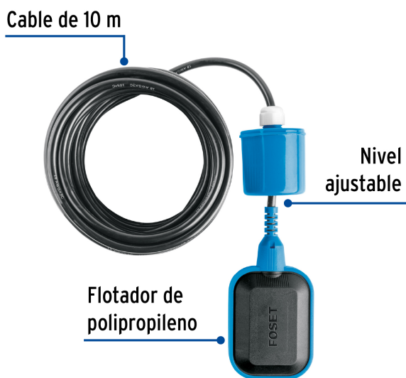
Diagrama de flotador