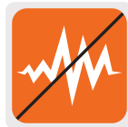
Sistema de mango antivibración