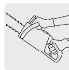
Ligera y potente, reduce la fatiga