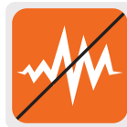
Sistema de mango antivibración