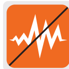
Sistema de mango antivibración