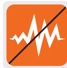
Sistema de mango antivibración