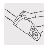
Ligera y potente, reduce la fatiga