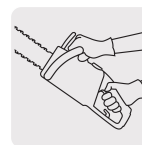
Ligera y potente, reduce la fatiga