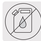
Libre de aceite