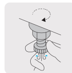
Válvula de drenado