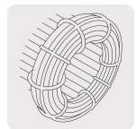
Motor con bobinas de cobre