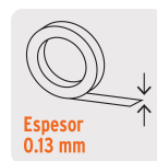
Espesor 0.13 mm