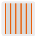
6 filamentos por cm