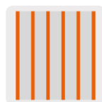
6 filamentos por cm