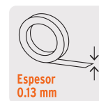
Espesor 0.13 mm