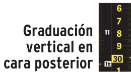
Graduación vertical en cara posterior

Cinta negra con marcado amarillo que proporciona un contraste claro para una fácil lectura en condiciones de baja iluminación y reduce el reflejo en trabajos a la intemperie