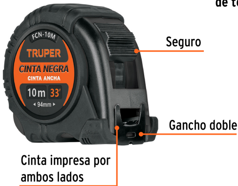
Cinta impresa por ambos lados