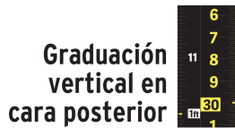
Graduación vertical en cara posterior

Cinta negra con marcado amarillo que proporciona un contraste claro para una fácil lectura en condiciones de baja iluminación y reduce el reflejo en trabajos a la intemperie