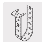
Cinta impresa por ambos lados