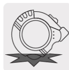
Resistente a impactos