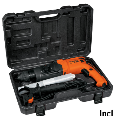
Incluye estuche de plástico