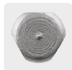
Zanco P3 antiderrapantes