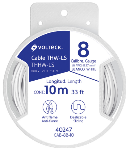
Carrete de plástico de 10 m