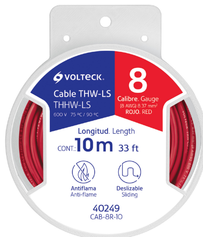
Carrete de plástico de 10 m