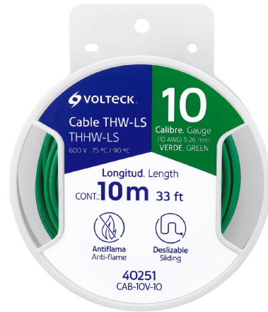
Carrete de plástico de 10 m