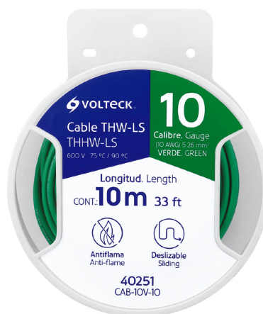
Carrete de plástico de 10 m