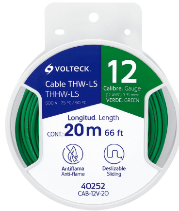
Carrete de plástico de 20 m