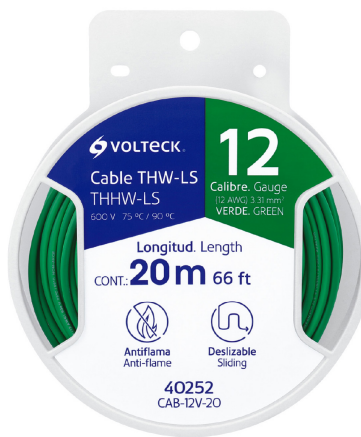
Carrete de plástico de 20 m