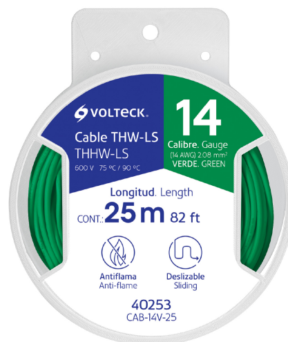
Carrete de plástico de 25 m